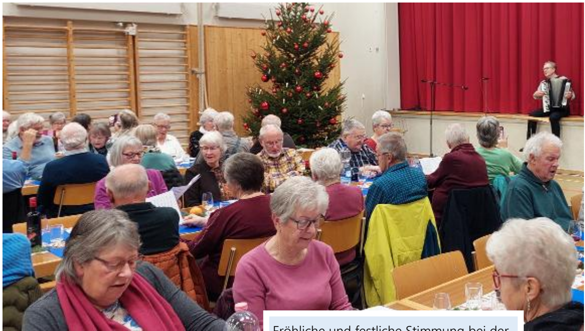
Fröhliche und festliche Stimmung bei der Seniorenweihnachtsfeier in der Turnhalle.