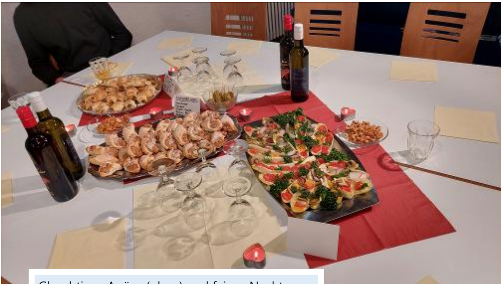
Gluschtiges Apüro (oben) und feines Nachtesen beim cook - eat - talk, dem Angebot für junge Leute nach der Konfirmation (rechts).