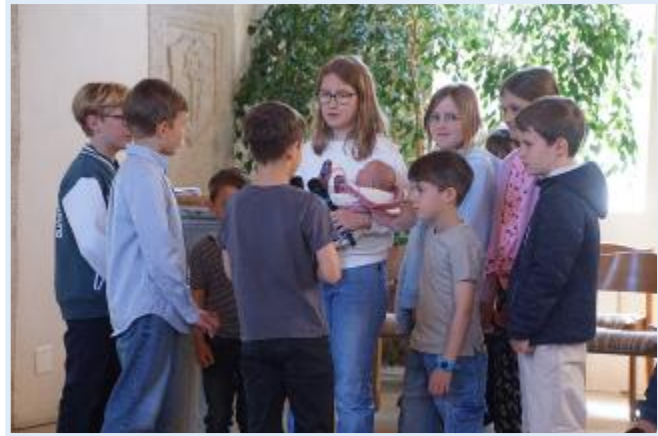
Mitgestaltung im Gottesdienst (oben), Fiire mit de Chliine (links), Sonntags- schule im Wald (unten rechts).

So zeigt sich: Verkündigung geschieht in unserer Gemeinde auf vielfältige Weise – in vertrauten Formen ebenso wie in neuen, kreativen Zugängen. Sie lebt vom Engagement vieler Beteiligten und von der Offenheit, immer wieder neue Wege zu gehen.