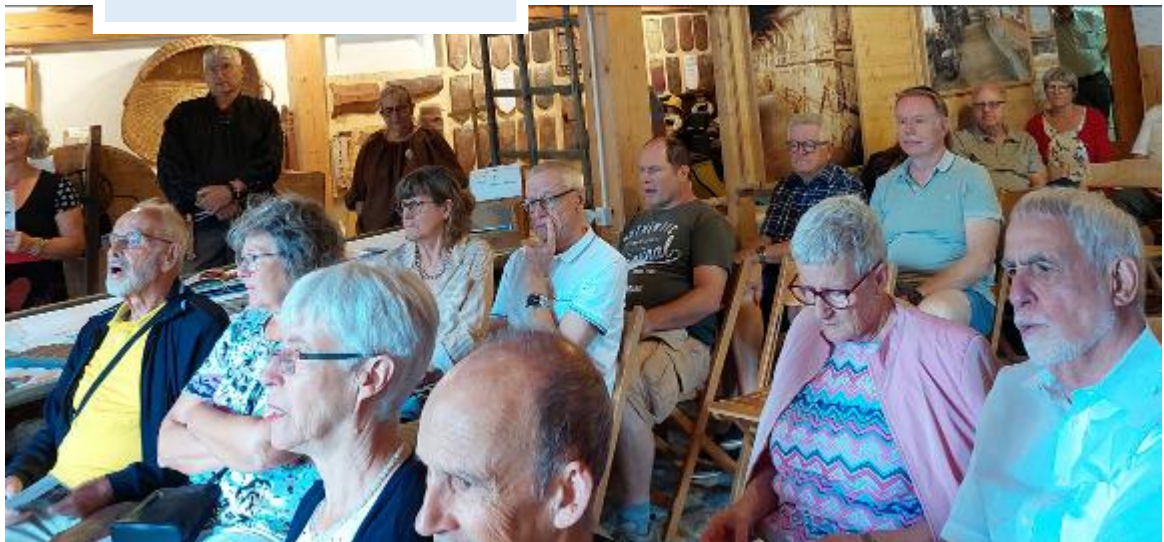
Gottesdienst im Museum Bözberg