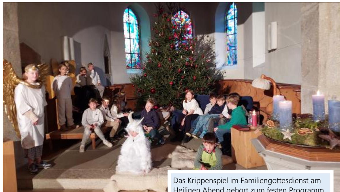
Das Krippenspiel im Familiengottesdienst am Heiligen Abend gehört zum festen Programm.