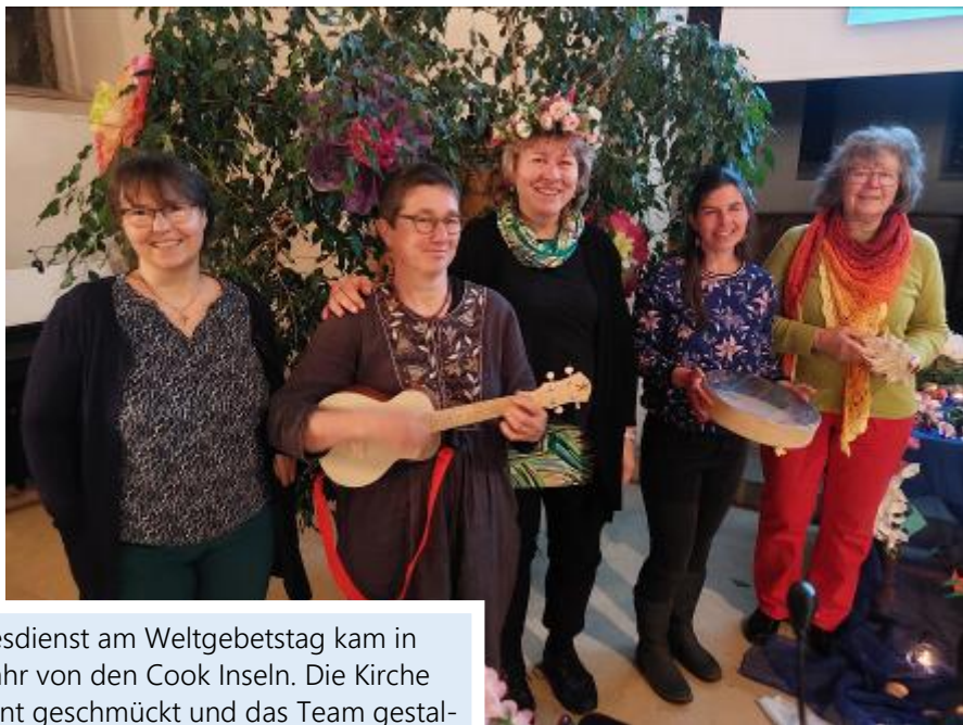
Der Gottesdienst am Weltgebetstag kam in diesem Jahr von den Cook Inseln. Die Kirche wurde bunt geschmückt und das Team gestaltete den Gottesdienst mit viel Engagement.