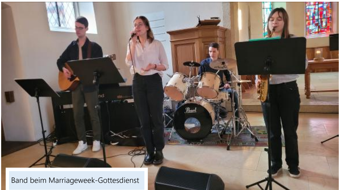
Band beim Marriageweek-Gottesdienst