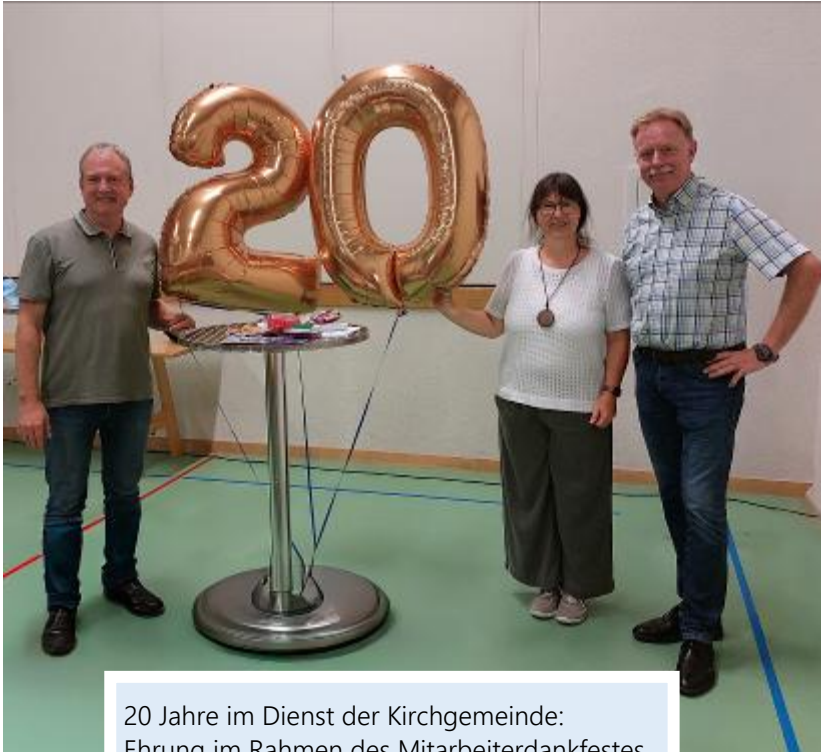
20 Jahre im Dienst der Kirchgemeinde: Ehrung im Rahmen des Mitarbeiterdankfestes.

mit tiefer Dankbarkeit und erfreuten Herzen blicken wir auf das Jahr 2025 zurück – ein Jahr, das reich war an Begegnungen, Wachstum und unvergesslichen Momenten, die unsere Gemeinschaft geprägt und gestärkt haben.