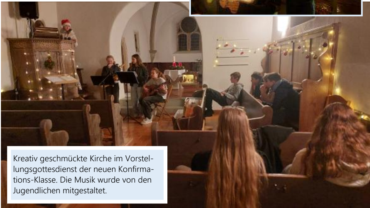
Kreativ geschmückte Kirche im Vor- stellungsgottesdienst der neuen Konfirmations- Klasse. Die Musik wurde von den Jugendlichen mitgestaltet.