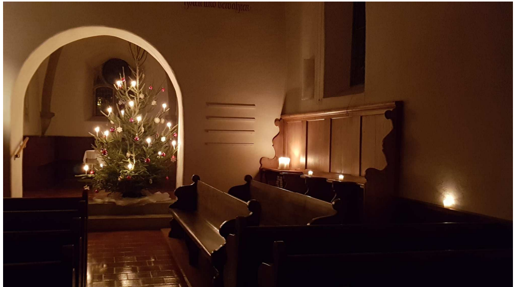
Weihnachtsstimmung in der Kirche Mönthal beim Abendgottesdienst am 10. Januar.

Aufgrund der aktuell noch unsicheren Corona-Situation hat die Kirchenpflege entschieden, die Konfirmation in diesem Jahr für Pfingstmontag, 24. Mai 2021 zu planen.