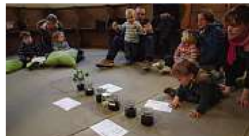
Anschaulich sind die Wachstumsphasen der Kräuter.

Erde stand im Mittelpunkt unseres Fiire. Wir hörten die Geschichte vom Säemann, der Samen auf die Erde streut, die dann langsam wachsen. Mit fröhlichen Liedern und einem selbstgestalteten Kräutertöpfchen gingen die Kinder und ihre Eltern reich beschenkt nach Hause.