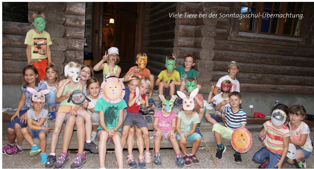
Viele Tiere bei der Sonntagsschul-Übernachtung.