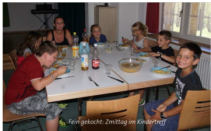
Fein gekocht: Zmittag im Kindertreff

Es war ein Abenteuer und für einmal ein besonderer Männertreff, zumal an diesem Anlass auch Kinder mit ihren Vätern willkommen waren. (TB)