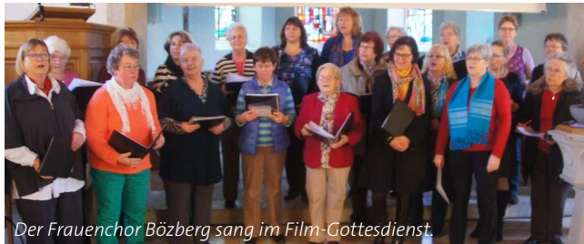
Der Frauenchor Bözberg sang im Film-Gottesdienst.