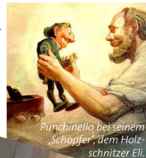
Punchinello bei seinem „Schöpfer“, dem Holzschnitzer Eli.

Im Familiengottesdienst der 3. und 4. Klässler lernten wir Punchinello kennen, den Wemmick mit den Punkten... Die Kinder führten eindrücklich vor, wie Sterne vergeben werden für her-